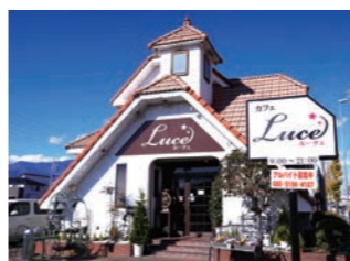
カフェ & レストラン ルーチェ 2021年11月、20号沿いのドルチェを引継ぎ、新規一軒OPENしたカフェ & レストラン。 レトロな雰囲気の中で、こだわりのコーヒーやホットサンド、パスタなどの軽食をお楽しみください。 ●住所：山梨県甲斐市富竹新田1473-1 ●TEL:055-269-8558 ●営業時間：Am 10:00 ~ Pm 9:00

私の場合は「言い続けること」「継続」が自分のアイデンティティに繋がっていると感じます。今という所のブランディングかなと。 自分らしさを発信していく方法は沢山ありますが、とにかく信用してもらえない限り、それは飾りもの。信用してもらってその上からしさと個性が乗ってくるものだと思います。僕にとって倫理は信用してもらえないような自分を作る土台。そのためには最高の場所だと思っている。継続してMSに出続けるなりして自分を信用してもらえ人間としての土台をつくる場として活用してみたいかなと思っています。