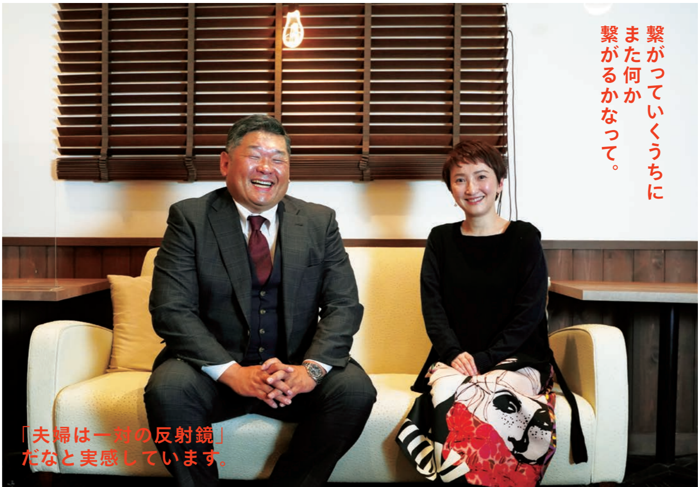
撮影協力：レストランラクール