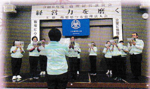
昨今朝礼実演：ユニテック株式会社