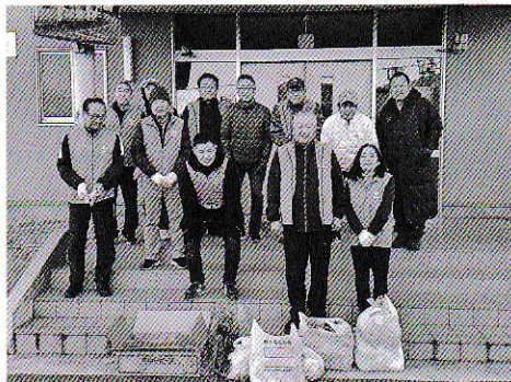
清掃作業（東桂小学校周辺）