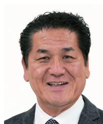
山梨県倫理法人会 副会長