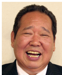
山梨県倫理法人会 相談役・法人スーパーバイザー