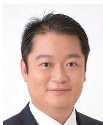
山梨県倫理法人会 顧問