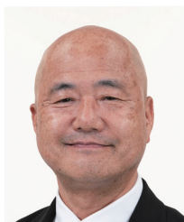
山梨県倫理法人会 会長