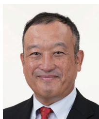
山梨県倫理法人会 幹事長