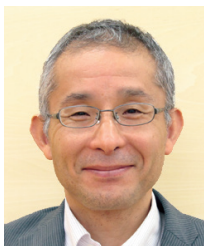
山梨県倫理法人会 監査