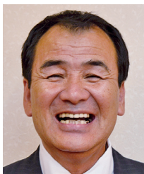
山梨県倫理法人会 相談役