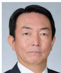
(一社)倫理研究所 法人局関東・甲信越方面方面長