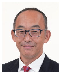
山梨県倫理法人会 副会長