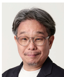
山梨県倫理法人会 事務長