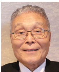
山梨県倫理法人会 相談役・名誉法人アドバイザー