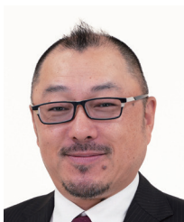
山梨県倫理法人会 副事務長