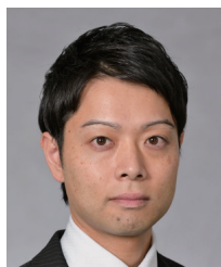
(一社)倫理研究所 法人局関東・甲信越方面研究員