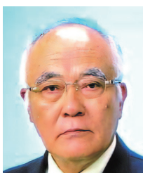
山梨県倫理法人会 相談役