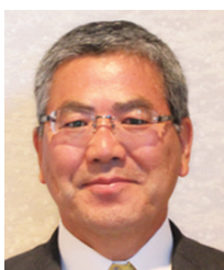
山梨県倫理法人会 相談役・法人アドバイザー