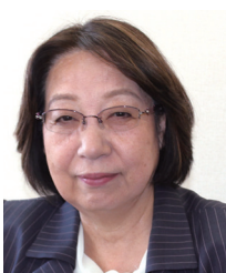
山梨県倫理法人会 相談役