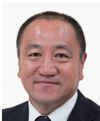
山梨県倫理法人会 副幹事長