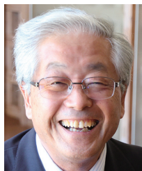
山梨県倫理法人会 相談役